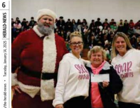
6 HERALD-NEWS Tuesdays, January 14, 2025 Herald-News/shawlocal.com/the-herald-news