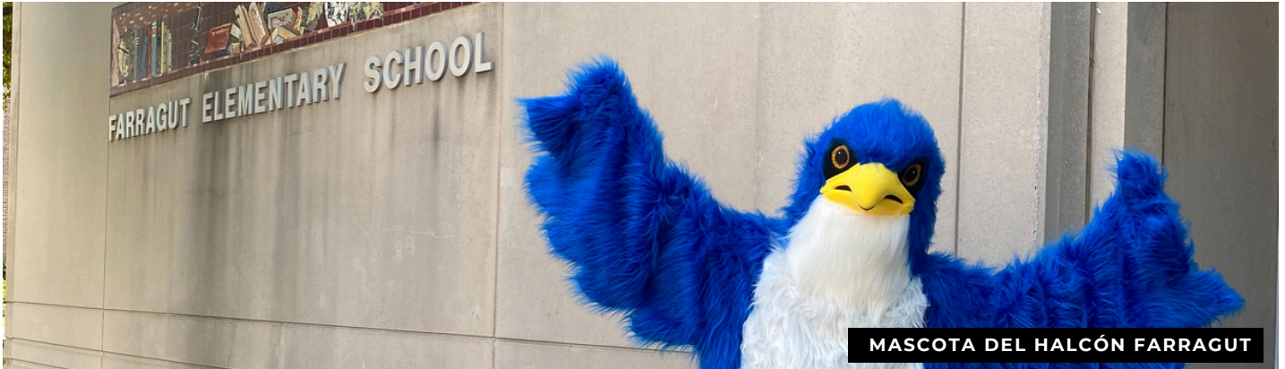
MASCOTA DEL HALCÓN FARRAGUT

📍 701 Glenwood Ave, Joliet, IL 60435 📞 815-723-0394